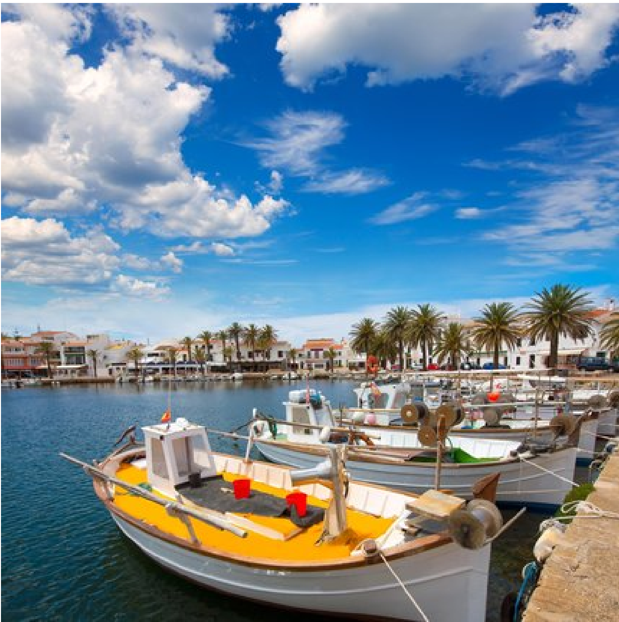
L'encantador poble pescador de Fornells

La caldereta és un emblema de Menorca, però la seva recepta varia tant d'un lloc a un altre com el mateix paisatge de l'illa. El bucòlic poble de pescadors de Fornells és, en certa manera, el paradís dels qui arriben a l'illa a la recerca de la caldereta perfecta. Les llagostes de Fornells són famoses perquè la zona nord és rocosa i, per tant, tenen més substància i sabor de marisc. Explorar la preciosa vila per trobar el restaurant ideal per menjar la teva caldereta és un pla idoni... I amb una recompensa insuperable.