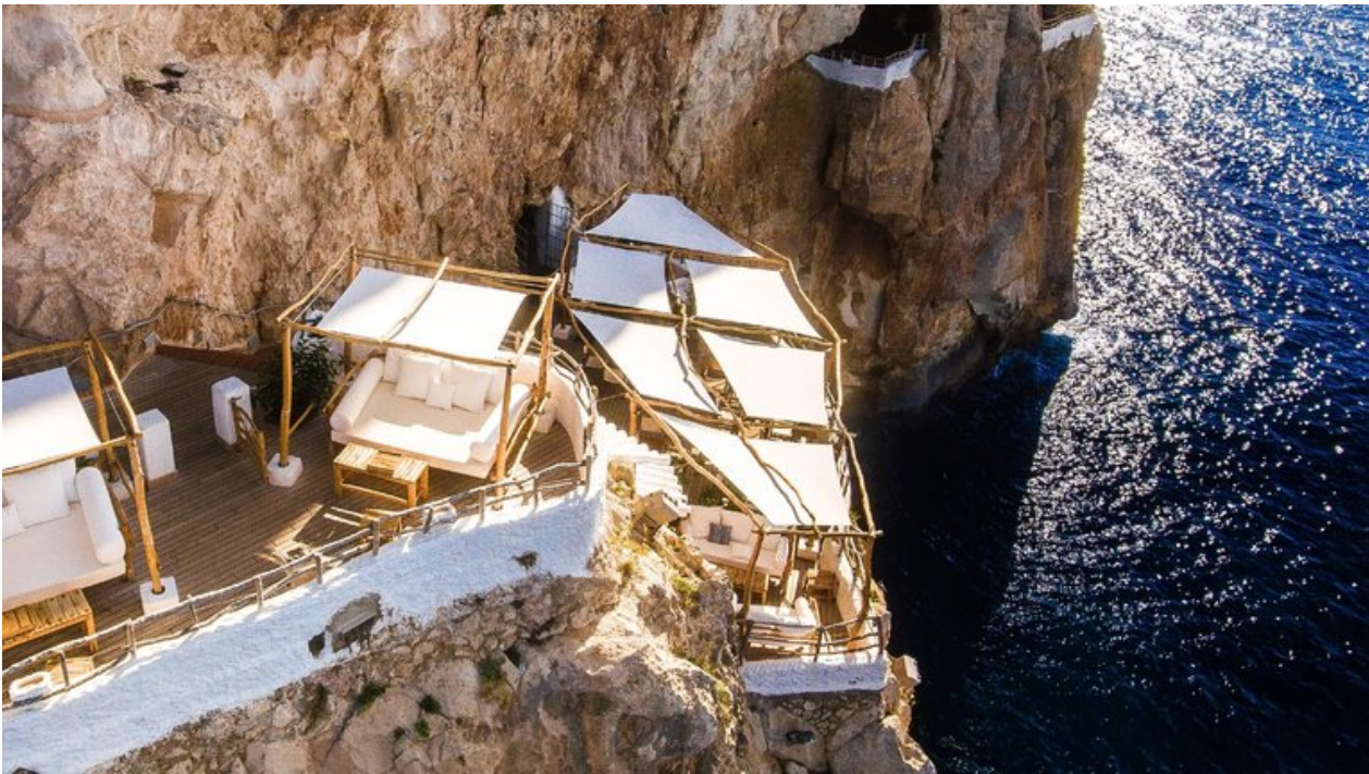
Vista aèria de l'espectacular Cova d'en xoroi, amb el mar al fons

La Cova d'en Xoroi és un d'aquells llocs espectaculars on anar a acabar d'arrodonir el dia després de sortir de la platja, treure's la sal i posar-te les teves millors arracades i mudes. Enclavada a trenta metres sobre el nivell del mar, aquesta terrassa de moda manté tota l'essència de Menorca amb les seves impactants vistes sobre el blau elèctric del mediterrani, el seu tracte proper, la música en directe i, evidentment, la beguda imprescindible dels menorquins: la mítica pomada.